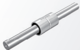
ボールスプライン

1978年にはマシニングセンタの元祖で当時世界トップクラスの米国工作機械メーカーに採用され、それを契機に工作機械へのLMガイドの採用が進んでいきます。