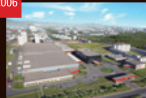
THK遼寧(中国)稼働 THK LM SYSTEM(シンガポール)設立