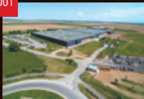
THK Manufacturing of Europe(フランス)稼働