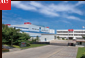
大連THK(中国)第2工場稼働 THK上海(中国)設立