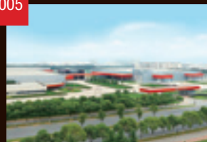
THK無錫(中国)稼働 THK中国(中国)設立