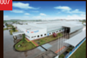
THK RHYTHM THAILAND(タイ)稼働