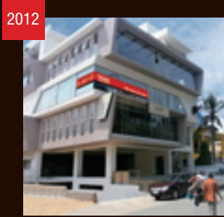
2012 THK India(インド)設立