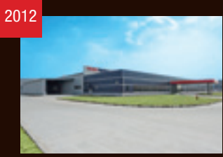
2012 THKRIZUM 常州(中国)稼働