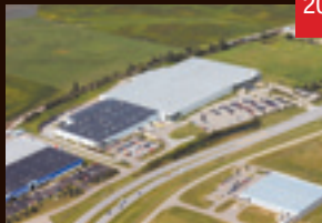
THK Manufacturing of America(アメリカ)第2工場稼働