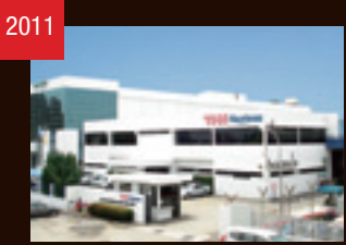
2011 THK RHYTHM MALAYSIA(マレーシア)を連結子会社化