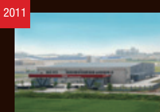
2011 THK MANUFACTURING OF VIETNAM (ベトナム)稼働