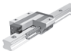
ボールリテーナ入りLMガイド

1990年代は、半導体の需要増加に伴い半導体製造装置向けにLMガイドの採用が急増しました。2000年代には、携帯電話やデジタル家電の普及とともに、半導体製造装置、フラットパネルディスプレイ製造装置などの需要が増加する中で、第二世代のLMガイドであるボールリテーナ入りLMガイドを中心とした製品の採用が増加しました。また、モノづくりのグローバル化が進展する中で、THKもグローバルにビジネスを展開していきました。