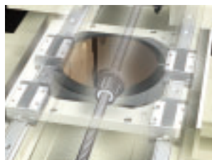
半導体製造装置(ダイシングソー)での使用例