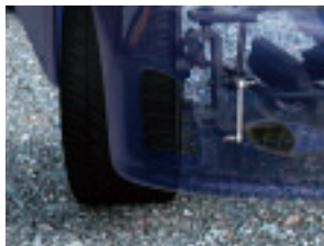
自動車での使用例