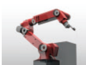
産業用ロボットでの使用例