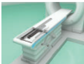
医療用機器(CTスキャナ)での使用例