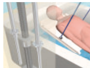
入浴介助装置での使用例