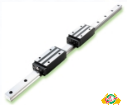
ボールリテーナ入りLMガイド

この開発コンセプトを具体化したのが、1996年に製品化した「ボールリテーナ入りLMガイド」です。ボールリテーナ入りLMガイドは、低騒音、低振動、低灰塵などの特長により作業環境面の改善に貢献しています。さらに高速性に優れ、メンテナンスが長期にわたって不要なうえ、製品に使用する素材や製造プロセスも、環境に与える負荷が小さいため、ユーザーから高い評価を得ています。