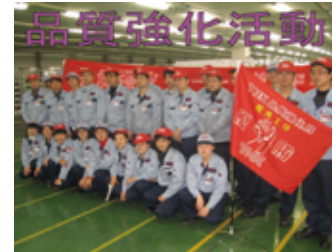
品質強化活動に向け、決起記念撮影

技術や精度だけではなく広い視野から高い品質の製品をめざす「ものづくり」の意識を持つように人財育成を行っています。さらには、日本の工場でも行われていない独自の「品質強化活動」を実施する等、高い意識のもとで品質活動に努めています。