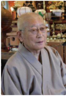
天守君山 願成就院 住職