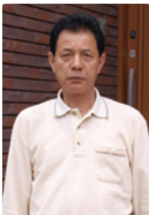
静岡県藤枝市 有限会社仲田工務店 代表取締役