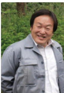
静岡県藤枝市 株式会社大長鐵工 取締役副社長