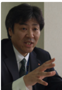
三島信用金庫 事務部 調査役

大地震発生後の速やかな事業活動の再開は、企業にとっての大事な社会的責任と言えます。金融機関において、地震災害によりサーバーがダウンし、顧客情報が流出したり、ATMが使用できなくなる状態は絶対に避けなければなりません。サーバーは通常ボルトで固定する方法が取られていますが、それだけでは不十分です。THKの免震サーバーは床に置くだけで、フロア全体の免震工事を施したのと同等の効果を得られます。