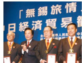
中国無錫市より「つつじ賞」受賞

拡大に貢献した企業、団体に授与される「つつじ賞」を受賞しました。これからも日中双方の文化や生活習慣を尊重する経営を行い、未永く地域から信頼される企業経営をめざしていきます。