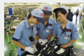
山形工場にて(写真 左)

今回研修したのはKRの標準品でしたが、私たちが今まで生産した製品とまったく違うものでした。部品の種類も多く、組立も大変難しかったです。指導者の熱心な指導で、研修は順調に進み、基本の手順と流れを覚えることができました。しかし、わずか1カ月間の研修でしたので、まだまだ足りないところがたくさんあります。これから無錫工場で『情熱』を持ってKRの生産を立ち上げ、「最高品質の徹底追求」を常に心掛け、自分に厳しく努力します。今後も日本での貴重な経験を忘れることなく、今回の研修成果を今後の仕事に活かし、THKグループにおける無錫工場の存在感を更に高めていきたいと思っています。