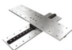
直動転がり支承CLB型